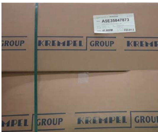
Ilustracja: przykład opakowania