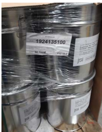
Ilustracja: przykład wyrobu

Zaangażowana w zdarzenie firma ubezpieczeniowa wyznaczyła nagrodę pieniężną o maksymalnej łącznej wartości 20.000 EURO za udzielenie wskazówek, które doprowadzą do odzyskania skradzionego towaru. Wysokość wyznaczonej nagrody wynosi 10% wartości towaru odzyskanego dzięki udzielonym wskazówkom, maksymalnie jednak 20.000 EURO.